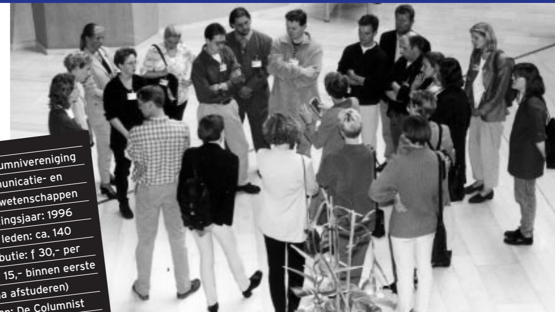
Rondleiding Gasunie 1997

Columni: alumnivereniging voor Communicatie- en Informatiewetenschappen - Oprichtingsjaar: 1996 - Aantal leden: ca. 140 - Contributie: f 30,- per jaar (f 15,- binnen eerste jaar na afstuderen) - Orgaan: De Columnist