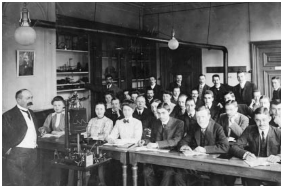
Worden klassieke onderwijsvormen overbodig?

een vraag niet meer te wachten tot het volgende college alwaar je de vraag vergeten bent, maar je mailt gewoon even.' Haar ervaring is dat op die e-mail spoedig een uitgebreid antwoord volgt.