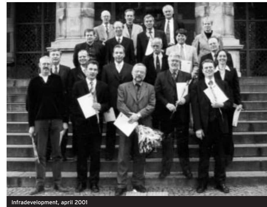
Infra-development, april 2001

Meer info: (050) 316 22 22 of enkelaar@aog.nl , www.academievoormanagement.nl